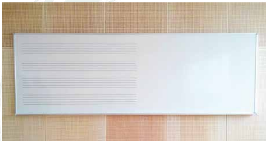
■平面ホワイトボード

学校でもオフィスでも。 サイズ特注、 枠線印刷のオーダーも承ります。 壁一面のホワイトボードや 移動式にも対応。