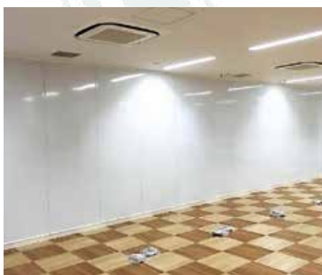
■壁面ホワイトボード