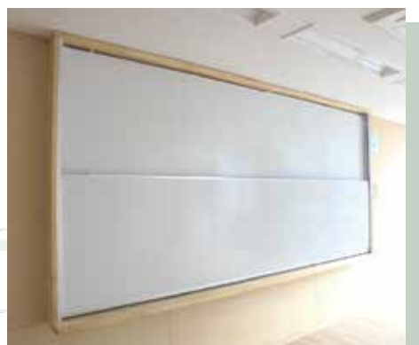
■上下ホワイトボード